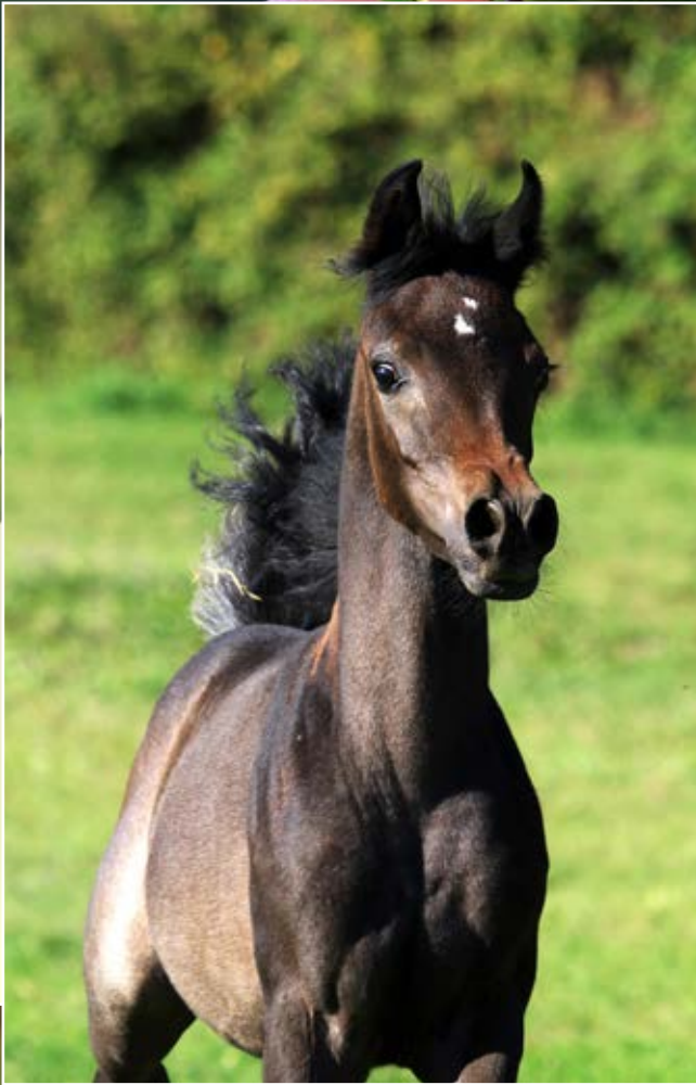
Ayda El Asil filly (Al Wahid El Dine by Salaa El Dine and Anisa El Asil by NK Kamar El Dine)