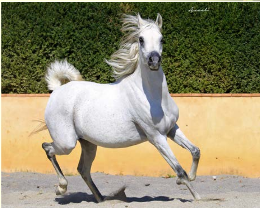
Masdar El Asil mare (Al Wahid el Dine by Salaa El Dine and Sadya el Asil By Coaltown and Abbas Pasha 1-6)