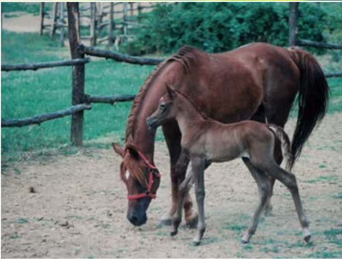
Katarin El Asil 2002 (Ashal Al Rayyan X Abbas Pasha 1-6 by Abbas Pasha 1 and 201 Ibn Galal by Hanadi )