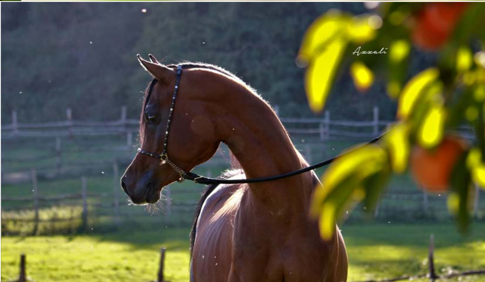
Ayal el Asil stallion ( Al Ayal AA x Ahlam El Asil by Coaltown and abbas Pasha 1-6)

e orecchie raffinate ereditate grazie alla forte presenza di Alaa El Dine EAO.