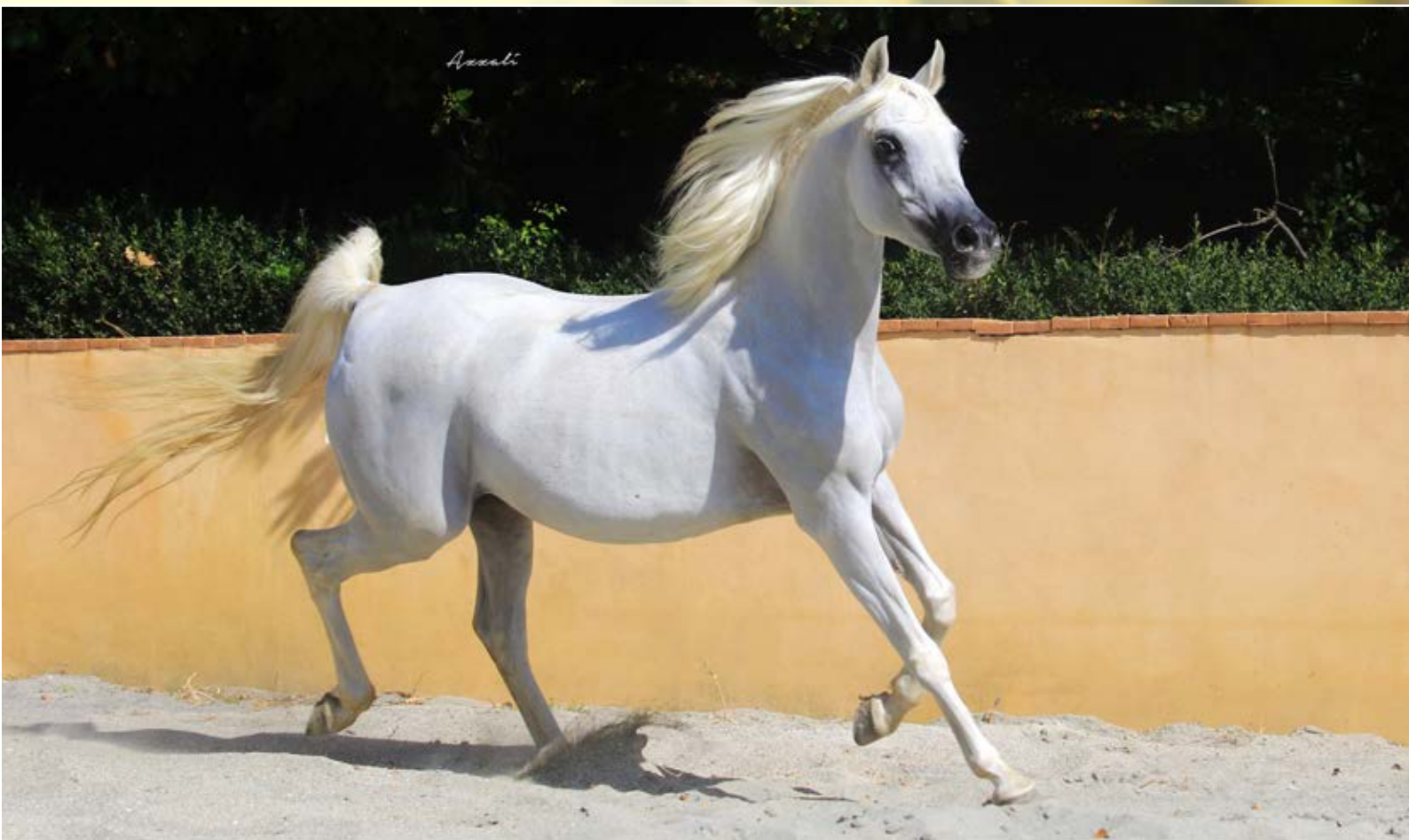
Hadiya El Asil mare (Ibn Nejdj x Hilal El Asil by Ibn Galal 1-9 and Abbas pasha 1-6)