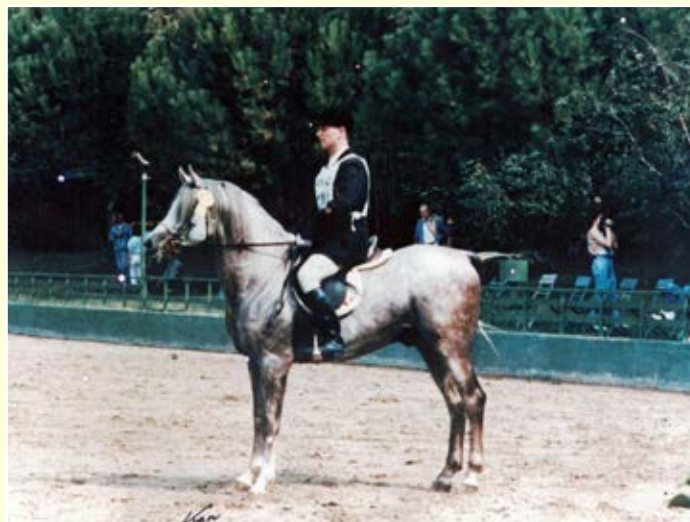
Ibn Galal 1-9 winner at Cervia 1988 English Pleasure category