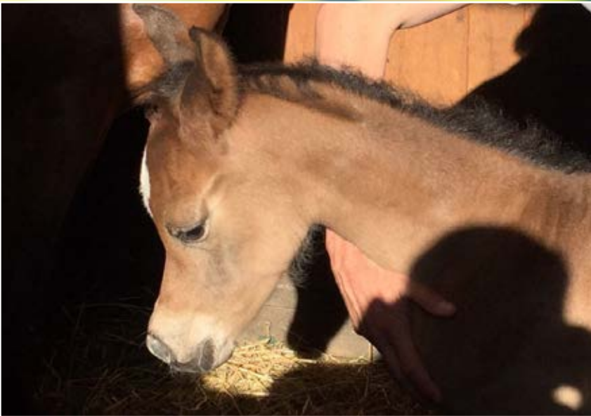
Helwa El Asil filly (Royal Colours x Helala El Asil by Al Ayal AA and Wardee El Asil) by Coaltown and Abbas Pasha 1-6